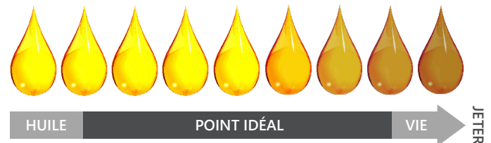
Pad filtrant Prime Filter

Le pad filtrant Primer Filter prolonge la durée de vie et la qualité de l'huile de friture jusqu'à 75 % par rapport au pad filtrant de charbon.